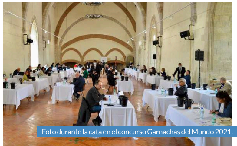
Foto durante la cata en el concurso Garnachas del Mundo 2021.

El concurso tiene la peculiaridad de que su sede es itinerante y viaja por las principales zonas productoras cada año. En la edición 2021 se han