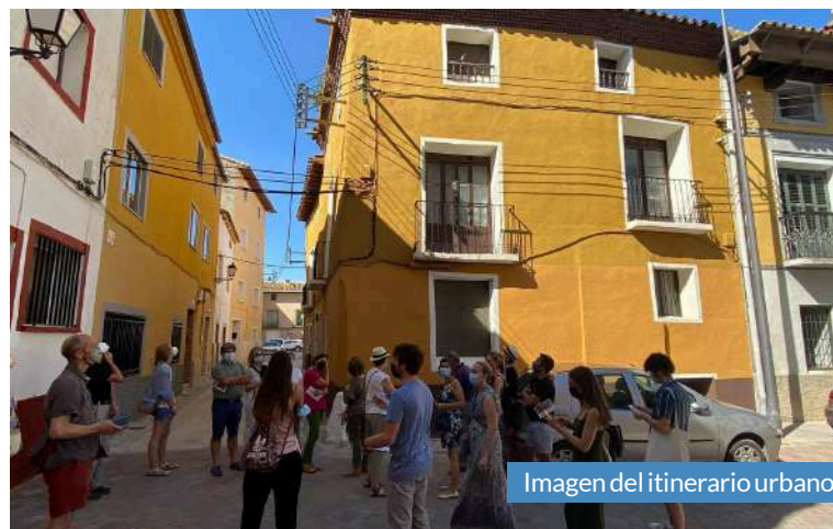
Imagen del itinerario urbano.

Tras la presentación del proyecto de investigación en la plaza de la Iglesia de la localidad, los asistentes disfrutaron de un recorrido por la localidad a modo de itinerario urbano guiado por la pareja de investigadores.