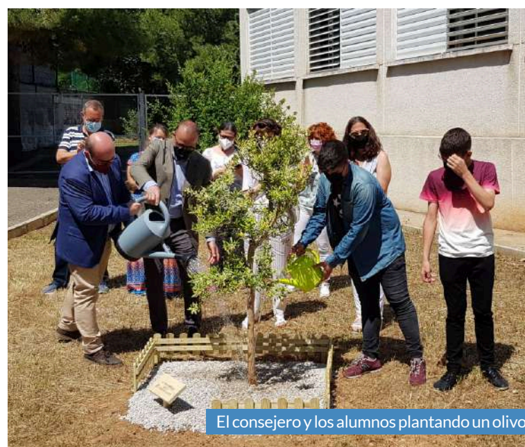
El consejero y los alumnos plantando un olivo.