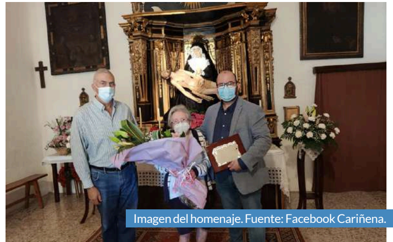
Imagen del homenaje.

cofinanciado, junto al Ayuntamiento, la restauración del altar, del baldaquino y las imágenes de la Virgen y el Cristo. Un valioso papel que ayuda a la conservación y el mantenimiento del rico patrimonio histórico y artístico de la localidad.