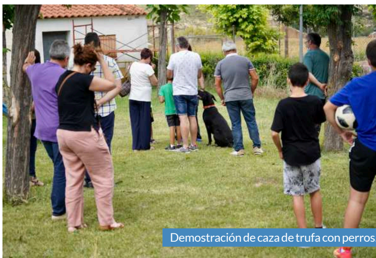
Demostración de caza de trufa con perros.