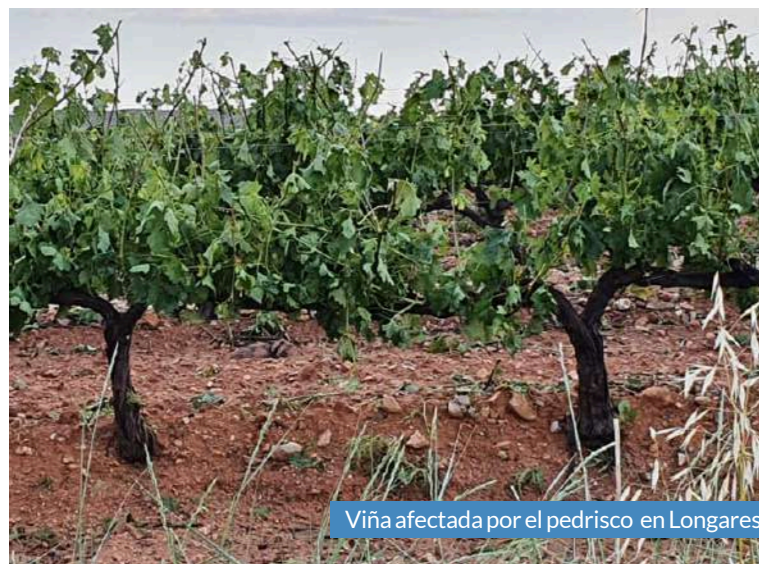
Viña afectada por el pedrisco en Longares.

Tras dar parte a los seguros y valorar los daños, se ha estimado que los agricultores recibirán una indemnización alrededor de los 7 millones de euros. Aunque, como desvelan fuentes de la zona, temen que las cosechas descubran los próximos meses otro tipo de daños que no son visibles tras la tormenta.