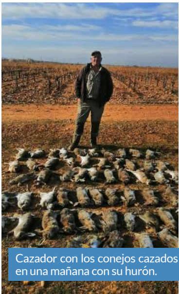
Cazador con los conejos cazados en una mañana con su hurón.

La sobrepoblación de conejos en la Comarca Campo de Cariñena continúa ocasionando importantes pérdidas económicas en el sector agrícola del territorio. Los daños cinegéticos en cultivos como el cereal, el almendro, el olivo y el viñedo cada vez son más graves ante una especie que continúa creciendo mientras arrasa con el duro trabajo de los agricultores.