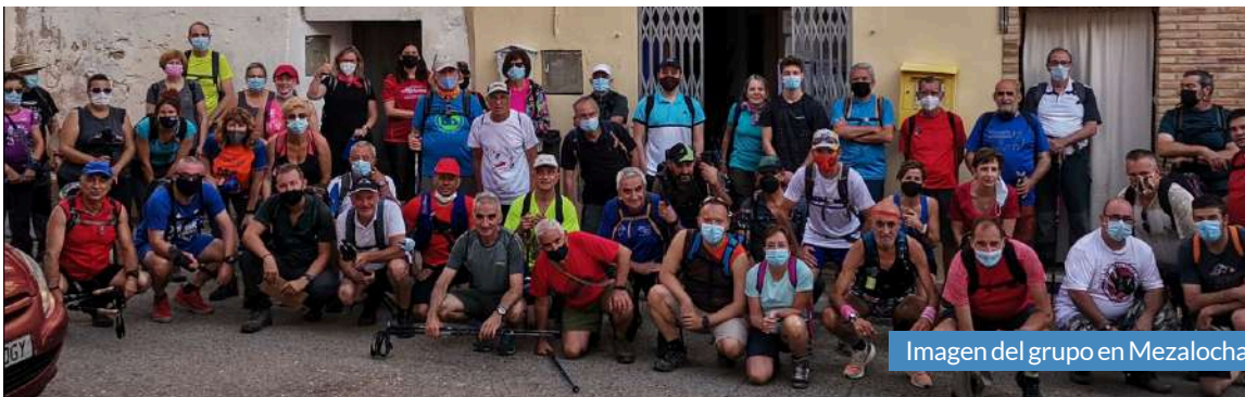
Imagen del grupo en Mezalocha.

una parada para almorzar y retomar fuerzas en el punto de avituallamiento instalado por el consistorio mezalochino. Después de este alto en el camino, los participantes continuaron con la marcha hasta completar la ruta, marcada en este caso por un vecino del municipio. Con esta andada, Juventud y Turismo de la Comarca Campo de Cariñena cierran la primera etapa del proyecto en 2021. Más de 500 personas se han sumado a esta iniciativa, que continuará en septiembre con su undécima edición y sigue consolidándose como una de las actividades favoritas entre los vecinos del territorio.