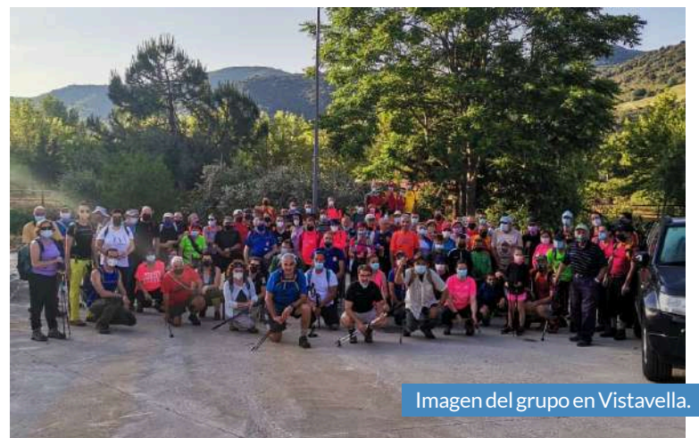
Imagen del grupo en Vistabella.