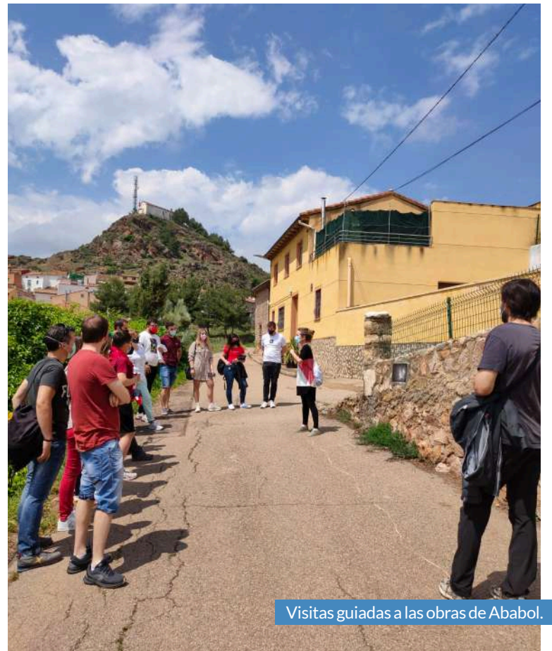
Visitas guiadas a las obras de Ababol.

especialistas en arte. El último domingo de cada mes se celebran visitas guiadas a las obras de las 3 ediciones pasadas por varios espacios públicos aladreneros con el fin de descubrir las curiosidades de las intervenciones, la historia y sus autores. Ababol Festival nació en 2017 para dinamizar el pueblo de Aladrén, atrayendo a artistas para realizar sus obras en el municipio y que dichas obras embellezcan el espacio público de la localidad. Los objetivos del Ababol Festival son fomentar el arte