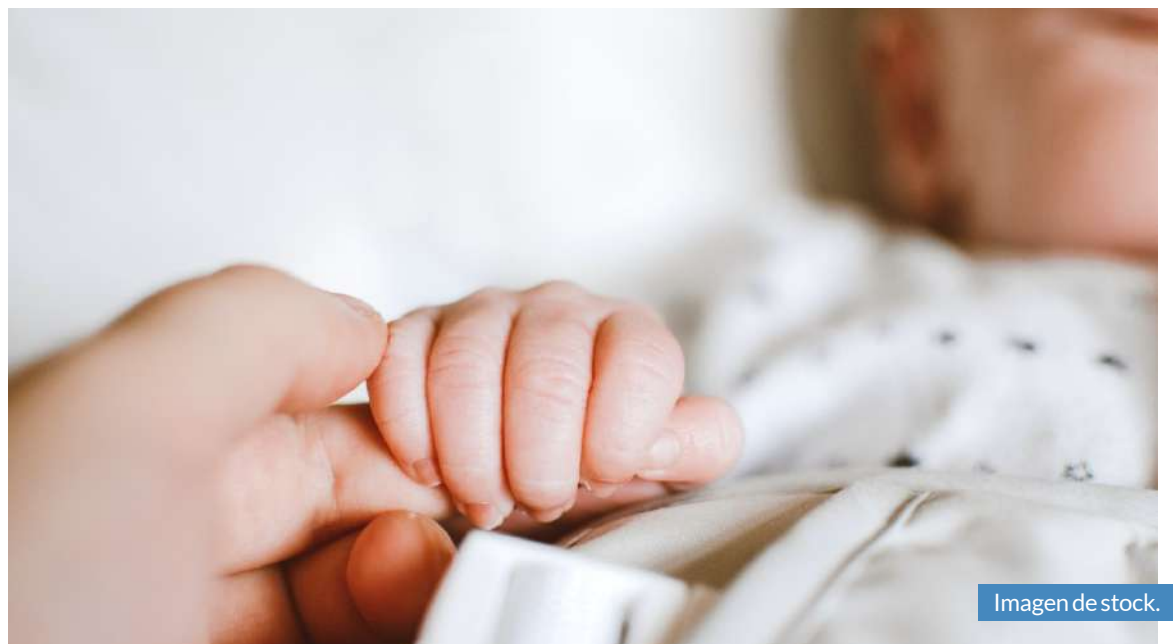
Imagen de stock.

Todos aquellos interesados, tienen hasta el día 23 de julio para solicitar la ayuda en el Registro General del Ayuntamiento.