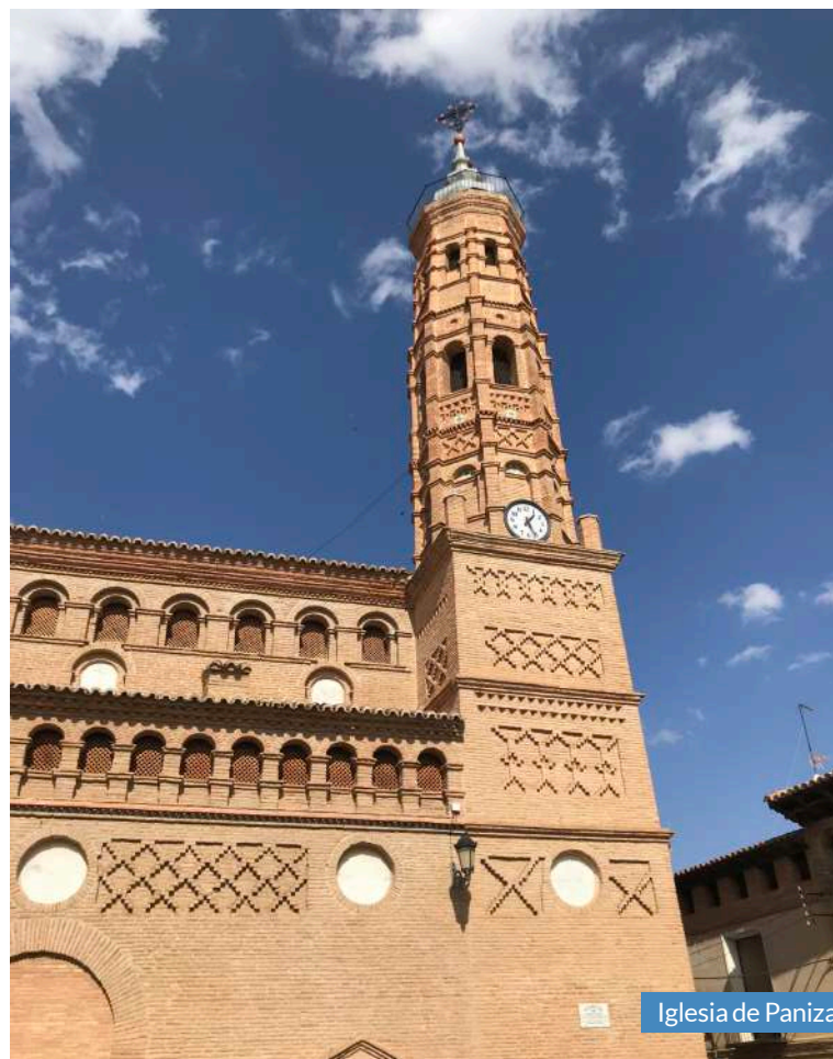
Iglesia de Paniza.

La iglesia ya ha sido objeto de diferentes intervenciones. Gracias a la recaudación del disco de la coral