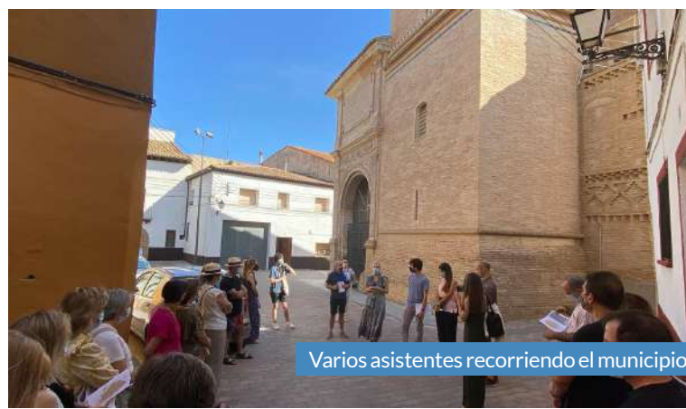
Varios asistentes recorriendo el municipio.