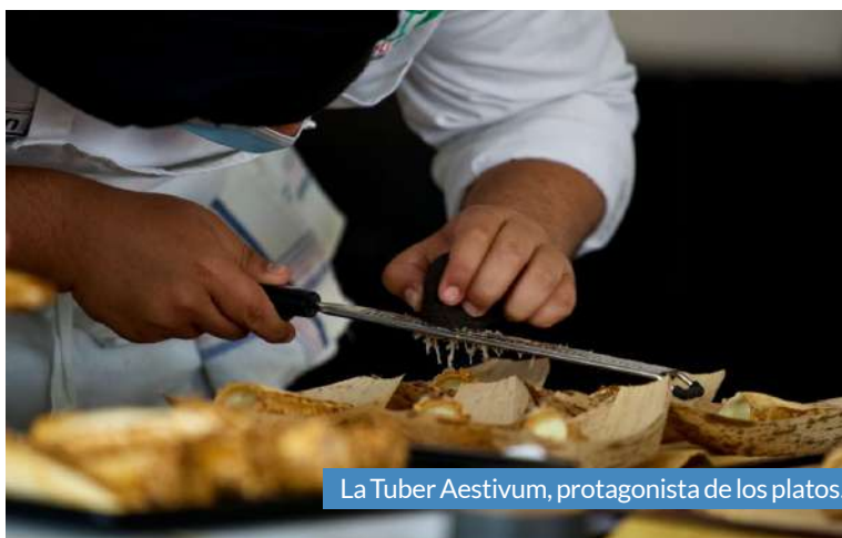
La Tuber Aestivum, protagonista de los platos.