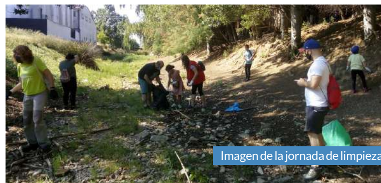
Imagen de la jornada de limpieza.

El objetivo de la actividad fue concienciar a todos los niños y mayores del daño que provocan todos esos residuos que posteriormente terminan en el mar.