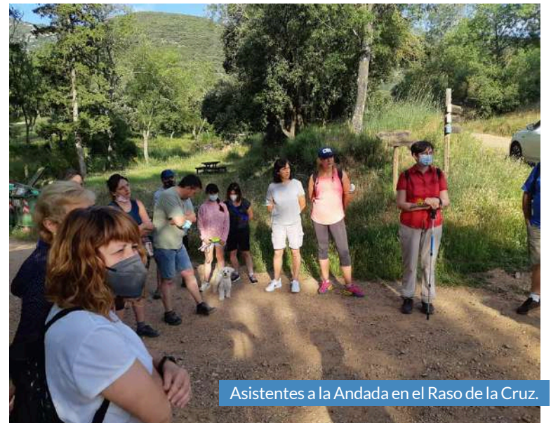
Asistentes a la Andada en el Raso de la Cruz.