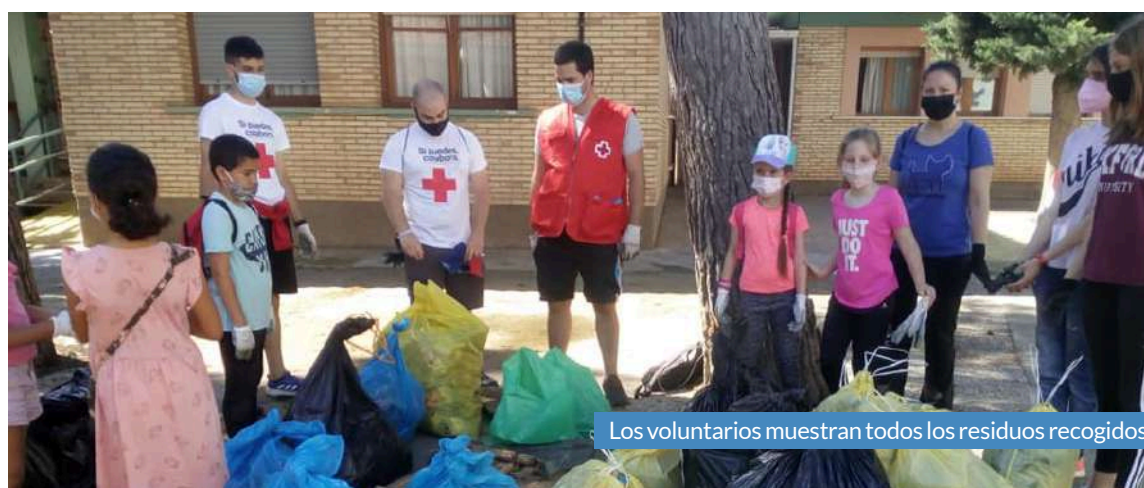
Los voluntarios muestran todos los residuos recogidos.