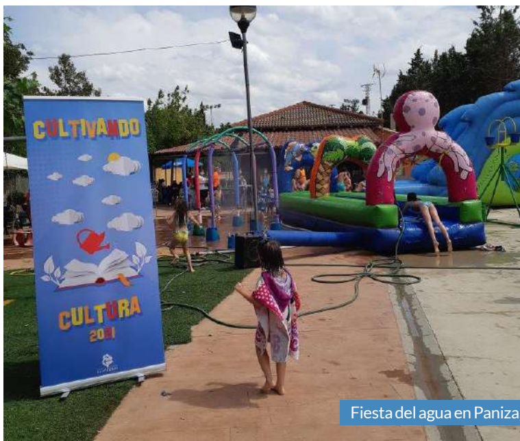
Fiesta del agua en Paniza.