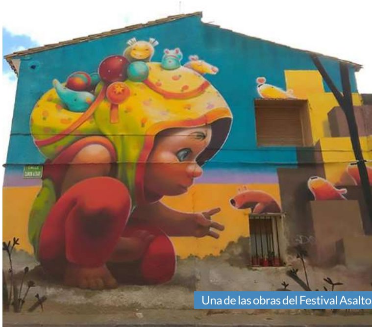
Una de las obras del Festival Asalto.

Del 2 al 8 de agosto regresa el proyecto de arte urbano Festival Asalto a Alfamén, una actividad de intervención artística en el medio rural planteada como fruto de una semana de convi-