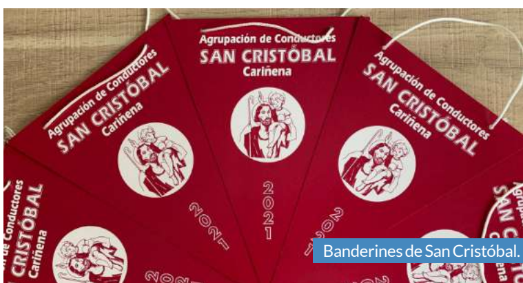
Banderines de San Cristóbal.

Desde la Comarca, se ha dado la enhorabuena a los vecinos ya que han sabido actuar desde la prudencia y la responsabilidad. Además, se ha expresado el ánimo para esta última etapa de camino hacia la normalidad, con vistas a todas esas fiestas que aún quedan por vivir.