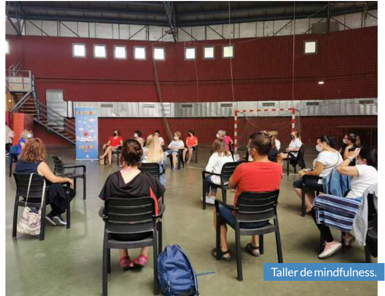
Taller de mindfulness.

La situación derivada de la pandemia continúa siendo complicada. Es por esto que, desde Comarca, se pidió a las personas que participaron en las actividades la máxima prudencia y el cumplimiento de todas las medidas de prevención: uso de mascarilla y gel hidroalcohólico y mantenimiento de la distancia de seguridad. Igualmente, se cumplieron los aforos permitidos y la asistencia a los talleres se realizó mediante inscripción previa en los Ayuntamientos de los diferentes municipios.