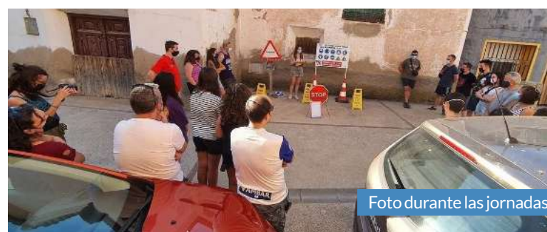
Foto durante las jornadas.