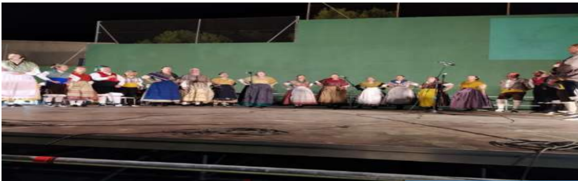
Actuación del Grupo Altomira.

En la Comarca Campo de Cariñena el folclore aragones también cuenta con un amplio número de seguidores. En este campo destaca el Grupo de Jota Altomira de Alfamén, que volvió a los escenarios a finales de junio para llenar de alegría al público de la Comarca.