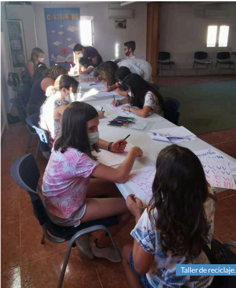
Taller de reciclaje.