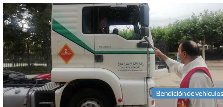
Bendición de vehículos.