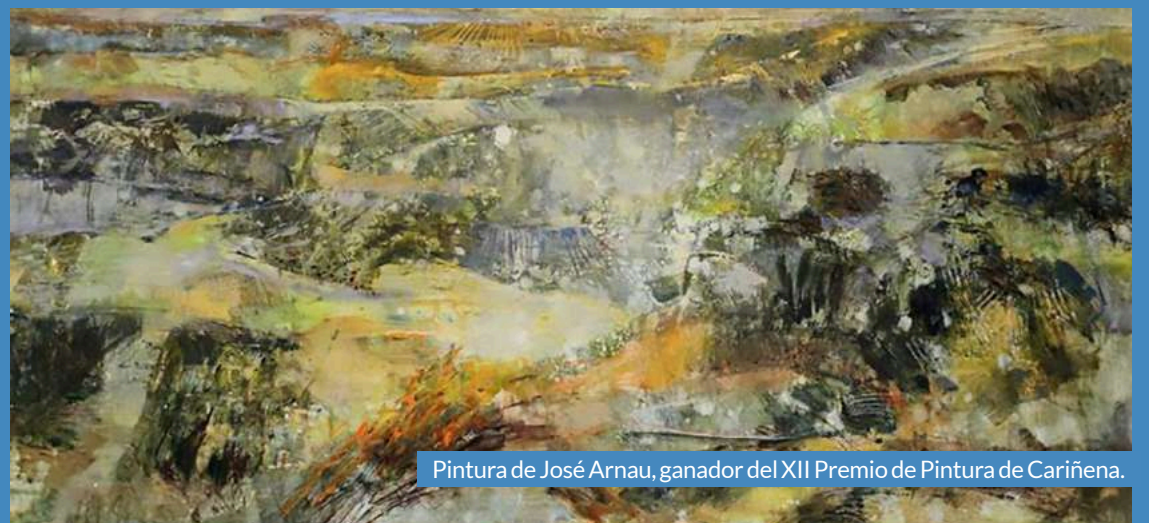
Pintura de José Arnau, ganador del XII Premio de Pintura de Cariñena.

oficinas municipales de Cariñena, en horario de 9 a 14 de lunes a viernes. Junto a la obra deberán entregar la solicitud de participación, una fotocopia del DNI o pasaporte, el currículum artístico del autor y una fotografía de la obra en formato digital.