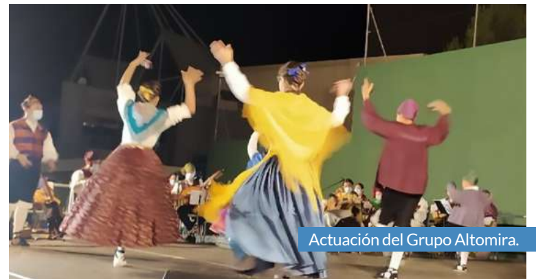
Actuación del Grupo Altomira.