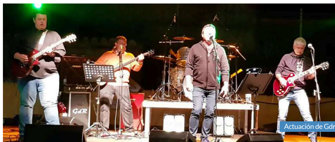
Actuación de Gdr.

una presentación de la filosofía del grupo con el repertorio elegido, de manera que intercalan canciones propias con versiones. Los integrantes del grupo se muestran deseosos de realizar más conciertos próximamente, y esperan poder llevar esa fuerza que los caracteriza a los municipios y los vecinos de la Comarca Campo de Cariñena.