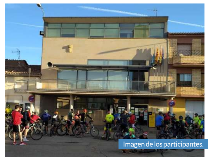
Imagen de los participantes.