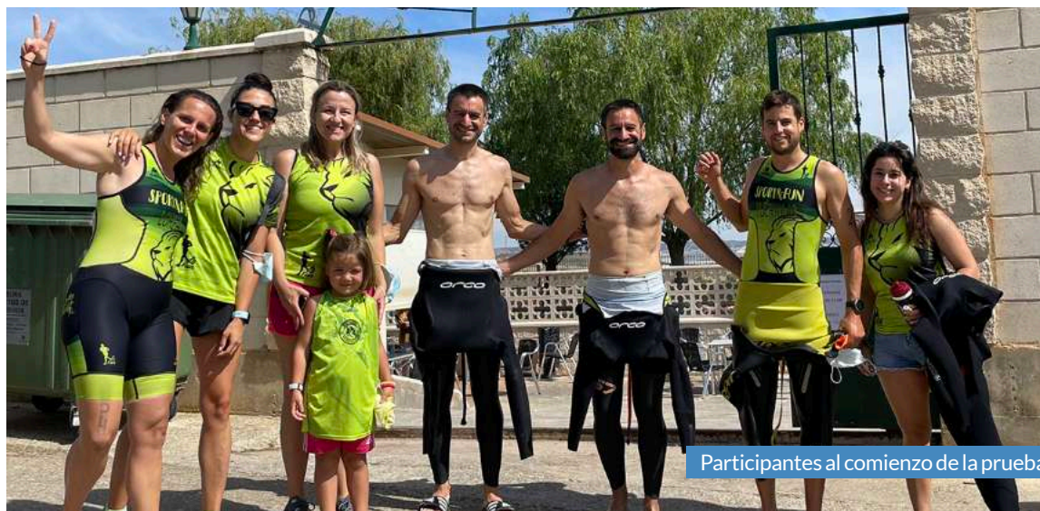
Participantes al comienzo de la prueba.