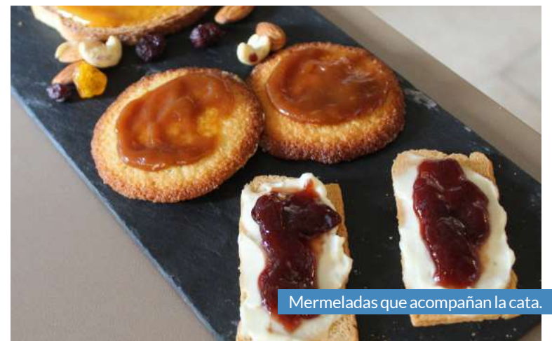
Mermeladas que acompañan la cata.

El pasado sábado 24 de julio, la bodega Tierra de Cubas volvía a llenarse con su novedosa actividad donde maridaron una selección de sus vinos, con mermeladas de la emblemática pastelería Manuel Segura, regalando a los asistentes una auténtica explosión de sabores.