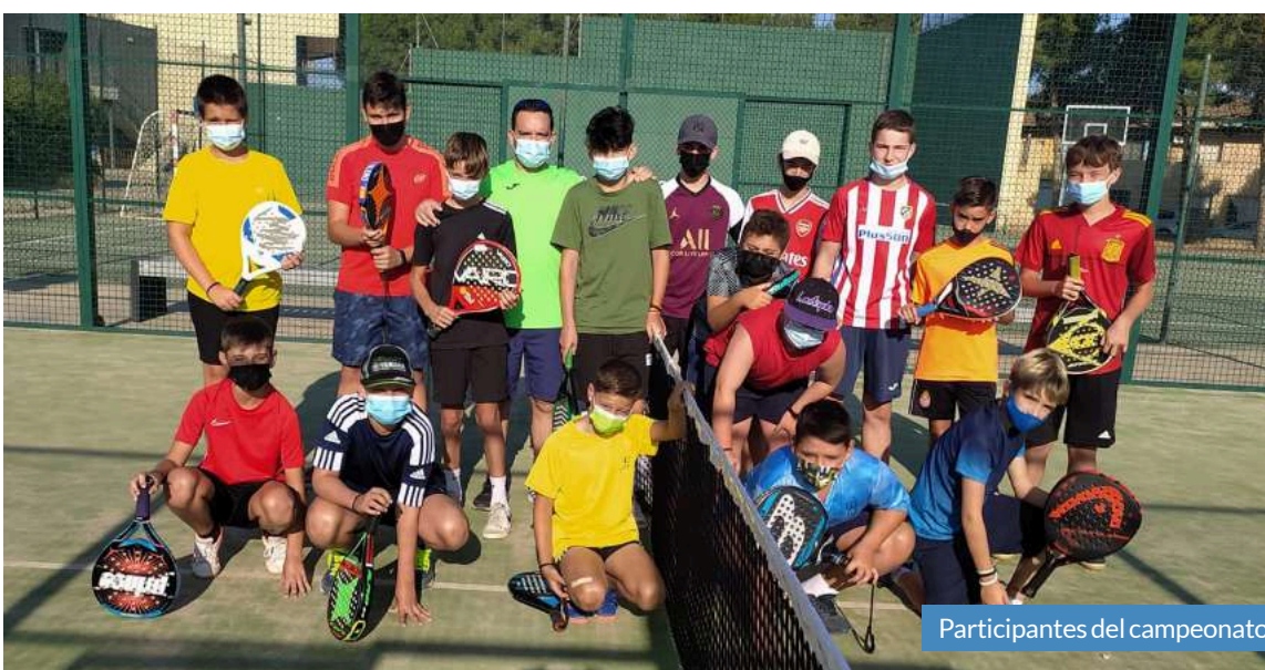
Participantes del campeonato.