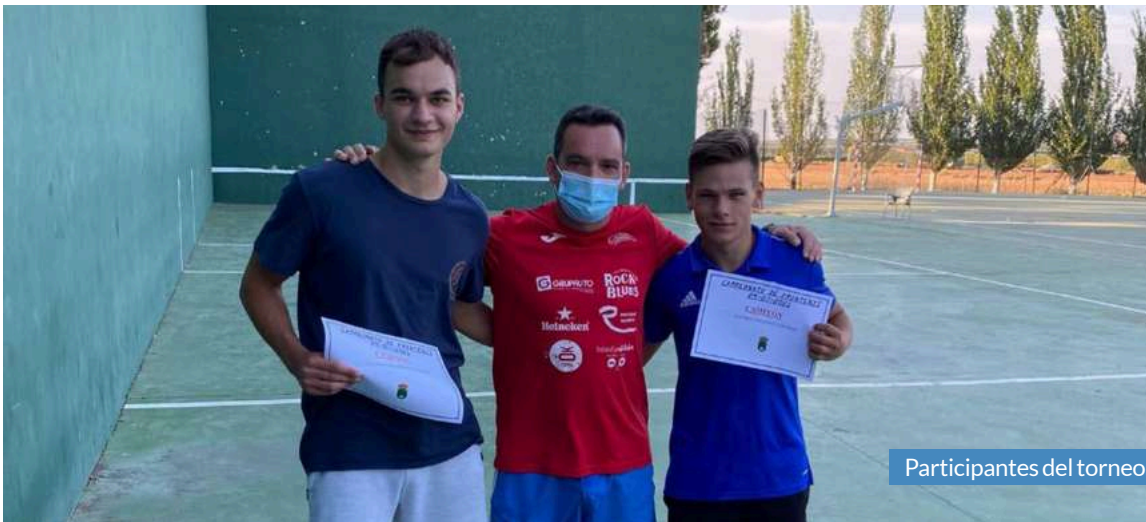
Participantes del torneo.