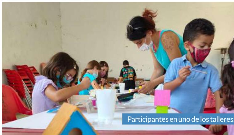
Participantes en uno de los talleres.