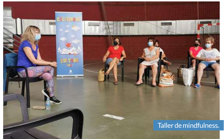
Taller de mindfulness.