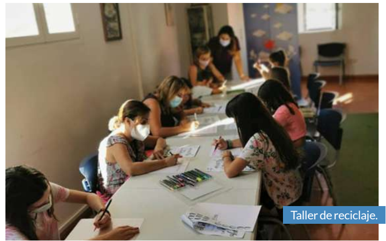
Taller de reciclaje.