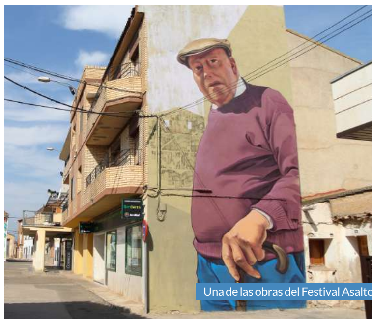
Una de las obras del Festival Asalto.