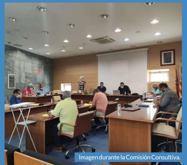
Imagen durante la Comisión Consultiva.

incluían la propuesta de acuerdo de aprobación del Convenio de aportaciones económicas para la financiación de los Servicios de Deportes y Servicios Sociales, así como al procedimiento de contratación de residuos de la Comarca.