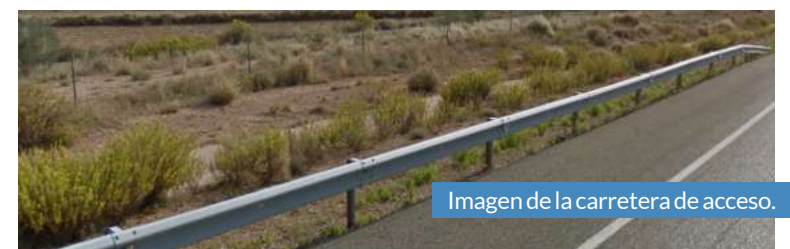
Imagen de la carretera de acceso.

de año se llevarán a cabo diferentes obras en otros puntos del pueblo. Entre ellas, la remodelación de la Plaza de España, deteriorada debido al paso de la borrasca Filomena. Además, se realizará una reforma de las aceras, aportando uniformidad a las vías y mejorando así la accesibilidad.