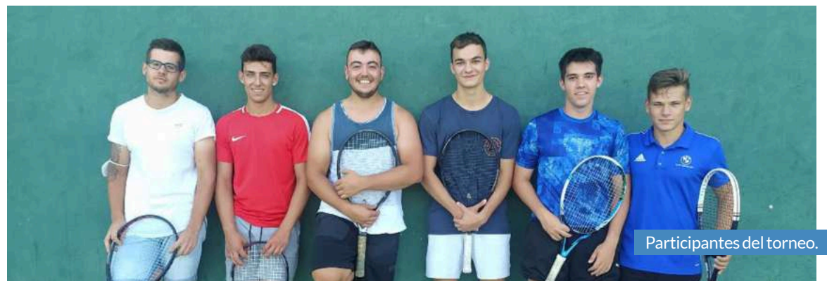
Participantes del torneo.

Alfamén celebró a finales de julio un divertido torneo de frontenis, con emocionantes partidos dado el gran nivel de todas las parejas participantes.