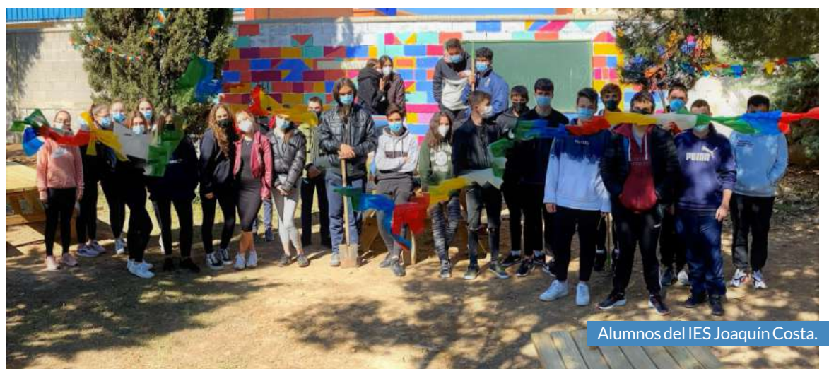
Alumnos del IES Joaquín Costa.