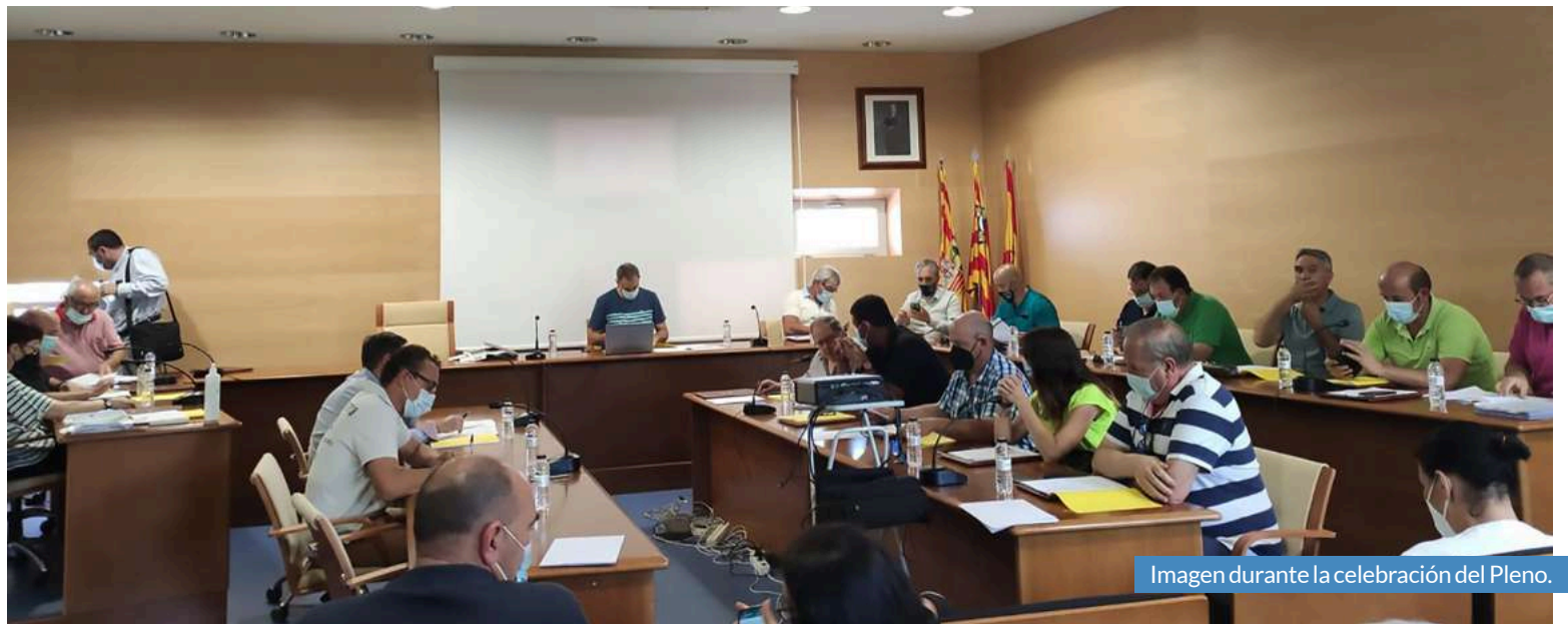
Imagen durante la celebración del Pleno.

La propuesta de acuerdo fue aprobada por 11 votos a favor, 7 en contra y 0 abs-