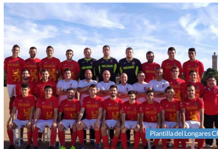
Plantilla del Longares CF.