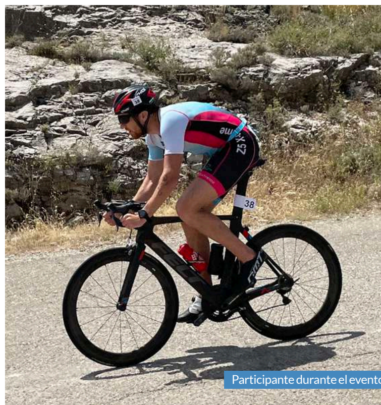
Participante durante el evento.