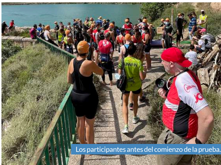
Los participantes antes del comienzo de la prueba.

Cabe destacar que el evento tuvo la presencia y participación de Ángel Santamaría, el legendario triatleta vasco de 72 años no se quiso perder la reapertura de esta carrera que lleva su nombre.