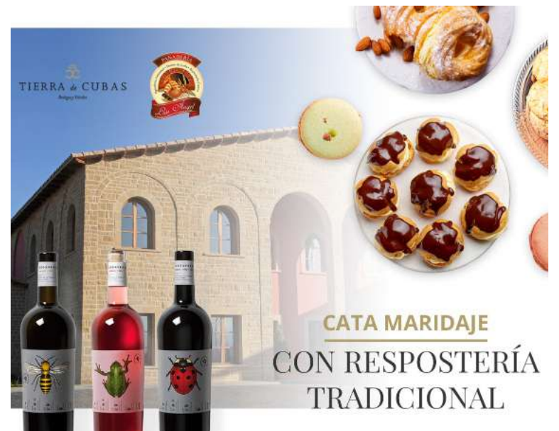
CATA MARIDAJE CON RESPOSTERÍA TRADICIONAL

nadería Luis Ángel de Almonacid de la Sierra, una panadería artesanal con horno de leña que impregna con su sabiduría y pasión cada una de las recetas tradicionales que elabora cada día en su obrador. Tras un cava de bienvenida, los asistentes disfrutaron de un relajado paseo por el maravilloso entorno de Tierra de Cubas, que finalizaron con la cata maridada con repostería tradicional; todo un regalo para los sentidos.