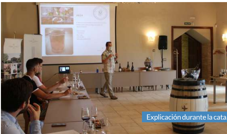
Explicación durante la cata.

El pasado sábado 24 de julio, la bodega Tierra de Cubas volvía a llenarse con su novedosa actividad donde maridaron una selección de sus vinos, con mermeladas de la emblemática pastelería Manuel Segura, regalando a los asistentes una auténtica explosión de sabores.