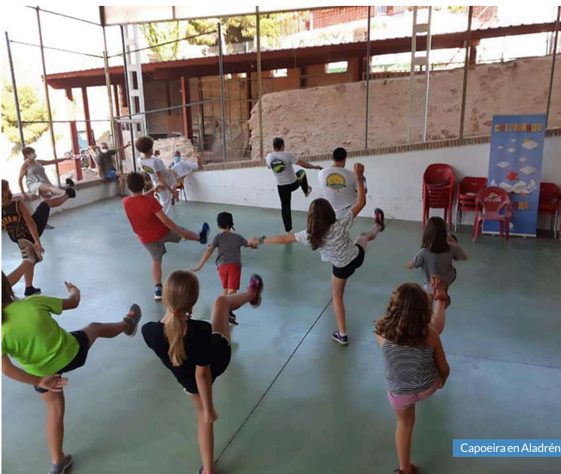
Capoeira en Aladrén.

trabajaban su agilidad, su resistencia y su destreza. La situación derivada de la pandemia continúa siendo complicada. Es por esto que, desde Comarca, se pide a las personas que participen en las actividades la máxima prudencia y el cumplimiento de todas las medidas de prevención: uso de mascarilla y gel hidroalcohólico y mantenimiento de la distancia de seguridad. Igualmente, se cumplirán los aforos permitidos y la asistencia a los talleres se realizará mediante inscripción previa en los ayuntamientos de los diferentes municipios.