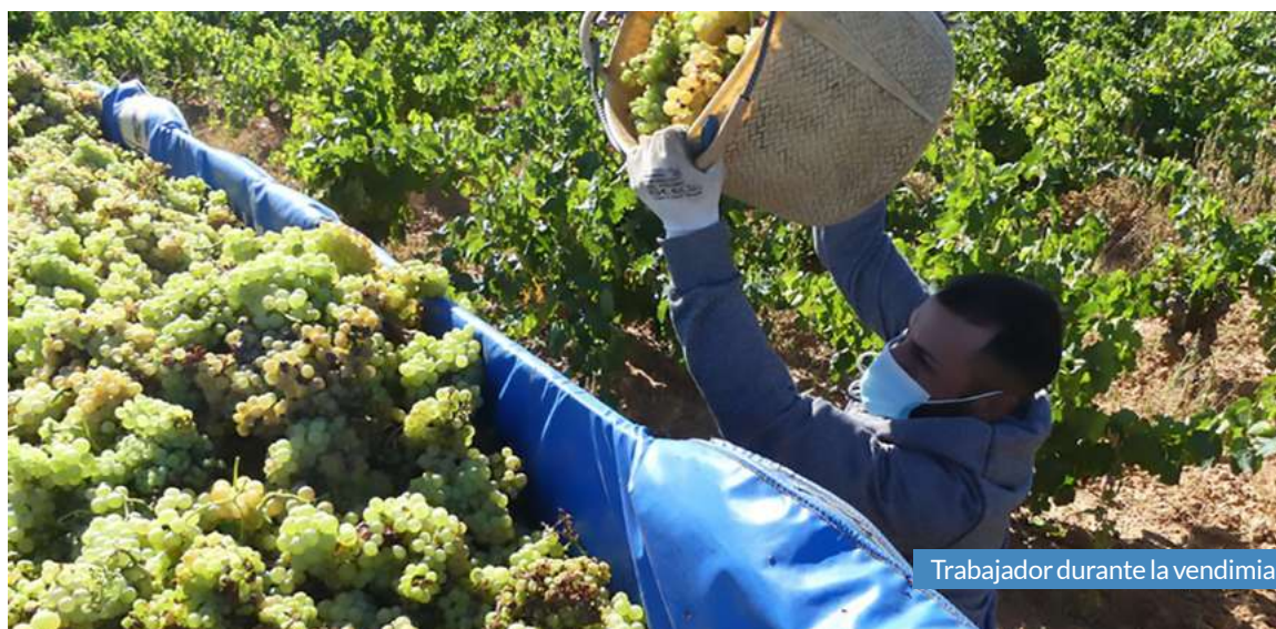
Trabajador durante la vendimia.

Como no podía ser de otra forma, la añada 2020 de la Denominación de Origen Protegida Cariñena recibe un año más la calificación de “muy buena”, tras dos décadas de excelentes calificaciones que han reafirmado la calidad de los Vinos de las Piedras, marca con la que se conoce la producción de la Denominación.