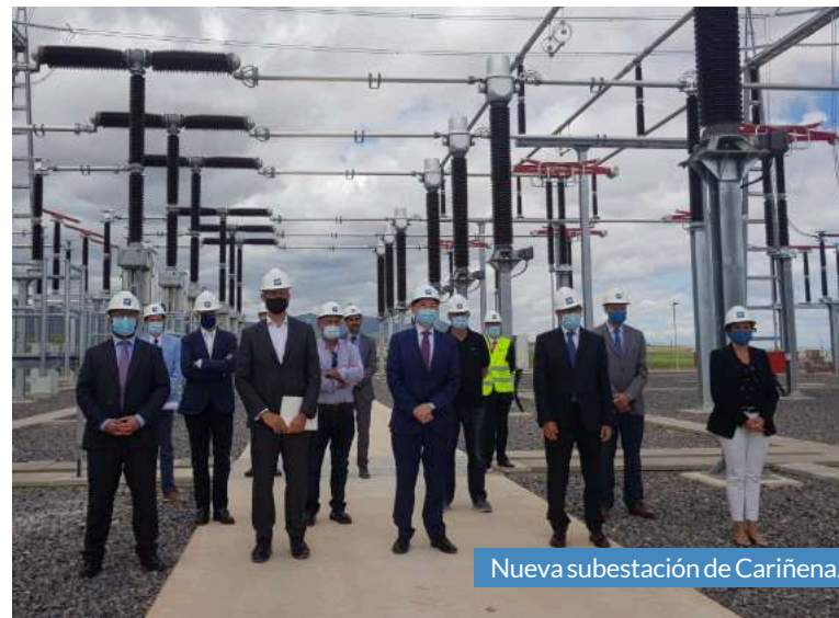
Nueva subestación de Cariñena.