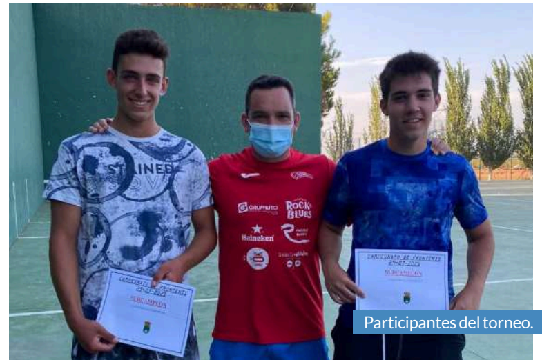
Participantes del torneo.