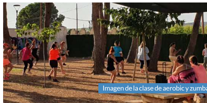
Imagen de la clase de aerobic y zumba.

ciones deportivas y las vistas del atardecer hicieron que la iniciativa fuera todavía más especial.