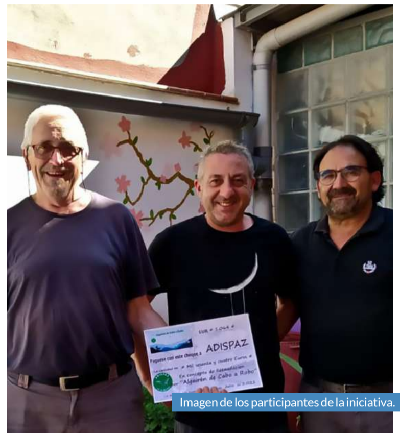
Imagen de los participantes de la iniciativa.

Los precursores de esta iniciativa se enorgullecen del trabajo de la asociación y todo lo que hacen por la inclusión. Adispaz tiene un piso en el cual están viviendo 4 jóvenes a los que varios monitores enseñan a realizar las tareas del hogar con la intención de que