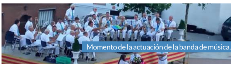
Momento de la actuación de la banda de música.

El tradicional concierto de la centenaria banda de música de Encinacorba, se desarrolló al aire libre por motivos sanitarios, un alegre aliciente que congregó una gran cantidad de espectadores que pudieron disfrutar de una brillante actuación en una espléndida tarde de verano.