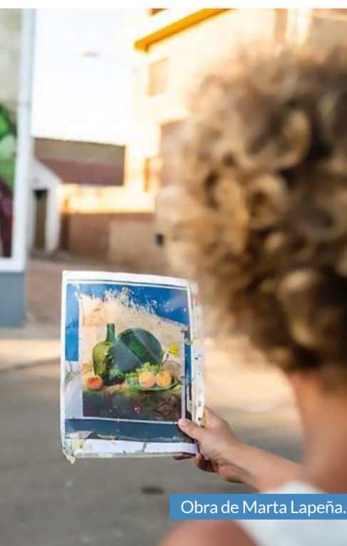
Obra de Marta Lapeña.