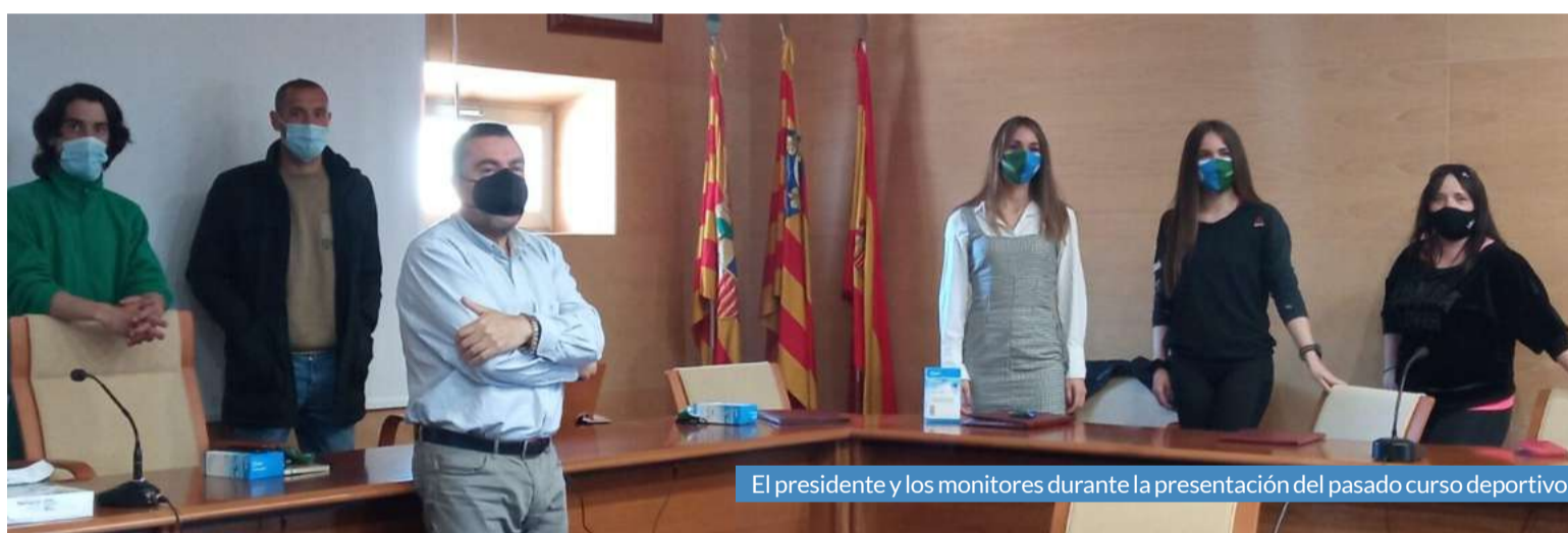
El presidente y los monitores durante la presentación del pasado curso deportivo.

La temporada pasada, que retrasó su inicio debido a la situación sanitaria, sirvió para establecer un protocolo sanitario que incluía todas las medidas de seguridad. Al comenzar las actividades se toman las temperaturas, es obligatorio el uso de la mascarilla, de gel hidroalcohólico y se cumplen las distancias de seguridad. El servicio establecerá una planificación en la que priman los grupos reducidos y los espacios abiertos y adecuados en cuanto a sus dimensiones.