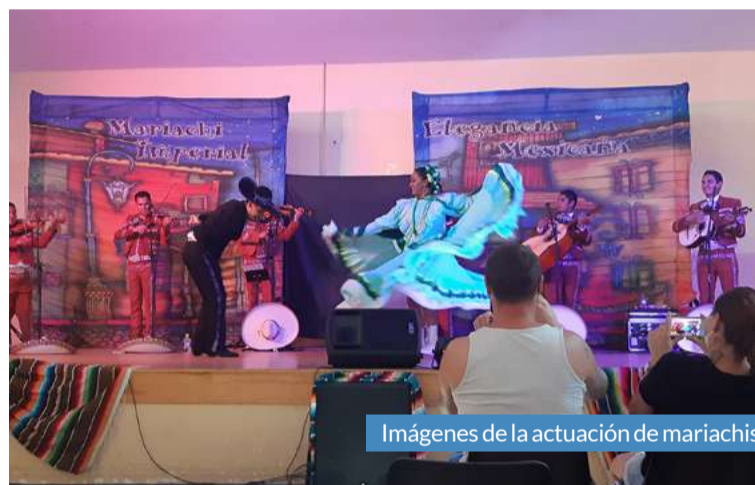
Imágenes de la actuación de mariachis.

destacaron las actuaciones de mariachis, diversos artistas y grupos teatrales. Los niños disfrutaron de los súper hinchables acuáticos y los más deportistas pudieron participar en los torneos de pádel con varias categorías.