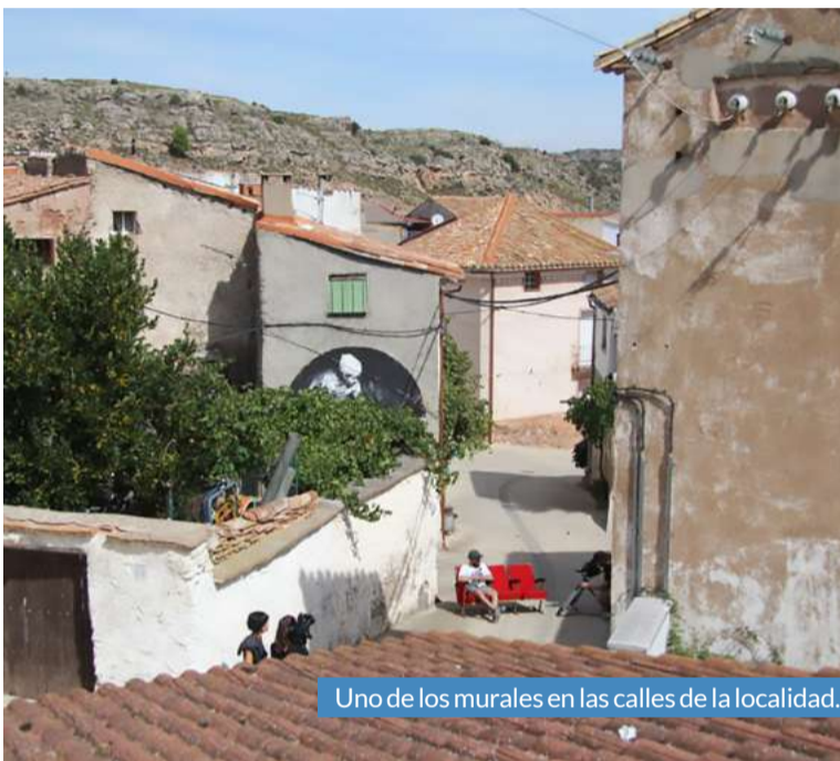
Uno de los murales en las calles de la localidad.

Hace unos meses dábamos la noticia que los amantes del arte urbano de la Comarca estaban esperando: habría una cuarta edición del Ababol Festival. A inicios de mes la convocatoria de participación se cerraba y los próximos días se harán públicos los nombres de los artistas participantes en el próximo certamen y el programa de actividades.