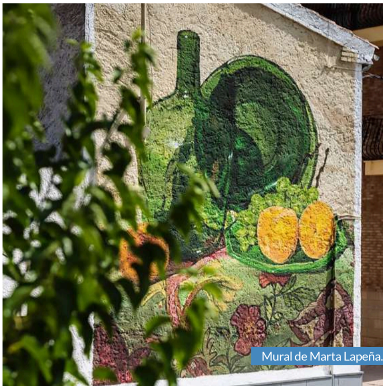
Mural de Marta Lapeña.