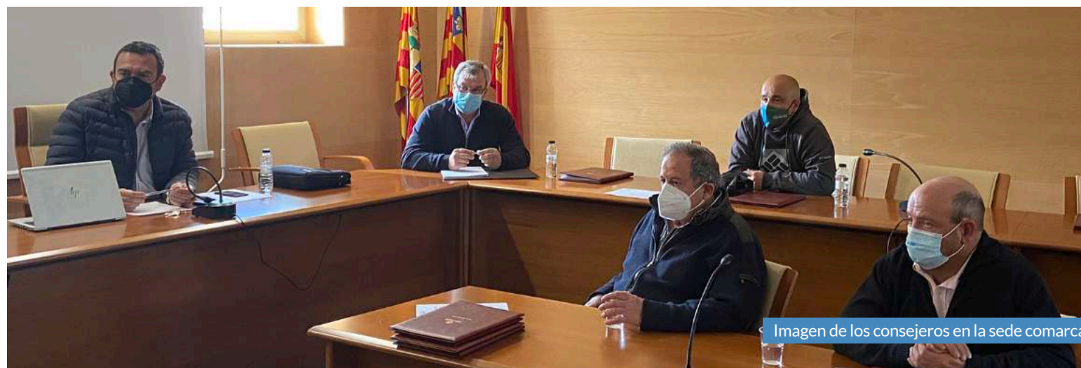
Imagen de los consejeros en la sede comarcal.

En referencia a la sobrepoblación de conejos, la DGA ha determinado no declarar plaga a esta especie a pesar de las apelaciones que se están llevando a cabo desde la Comarca y califican el problema como “una cuestión natural”, según ha declarado al diario José Luis Ansón. Los próximos meses se continuará apelando para poner fin a los daños cinegéticos en cultivos como el cereal y el viñedo, que cada vez son más graves ante una especie que sigue creciendo mientras arrasa con el duro trabajo de los agricultores.