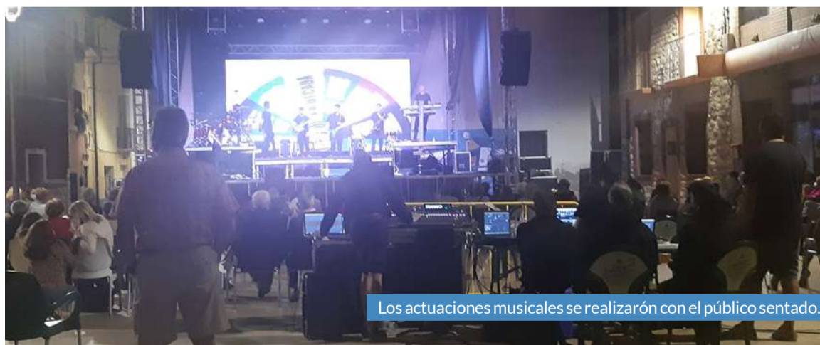
Los actuaciones musicales se realizarón con el público sentado.

TODAS LAS NOTICIAS DE LA COMARCA A TU ALCANCE