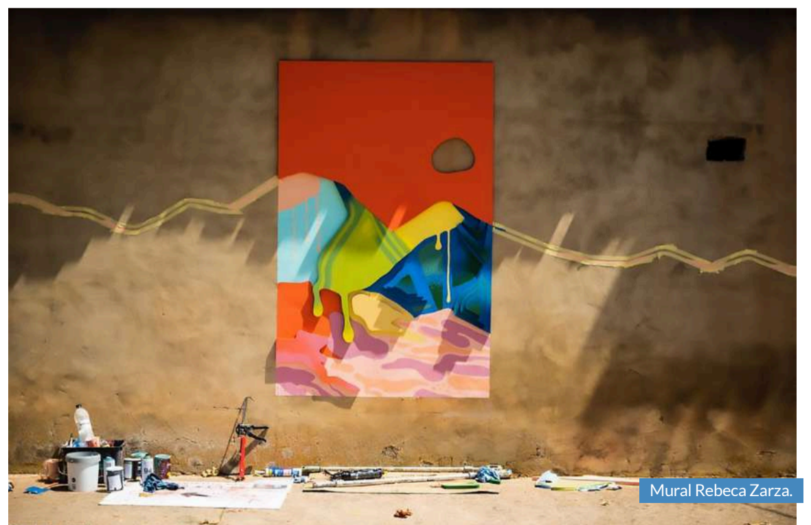
Mural Rebeca Zarza.