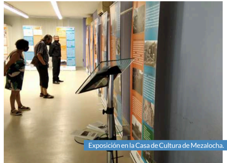
Exposición en la Casa de Cultura de Mezalocha.

Bajo Huerva. Tras comenzar en Mezalocha, la exposición estuvo en María de Huerva del 12 al 15 de agosto, y en Mozota del 27 al 29 de agosto. Otras localidades como Cadrete o Muel también contarán con esta exhibición que se puede visitar por las mañanas de 11 a 13 horas y por las tardes de 18 a 20 horas.