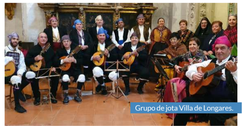
Grupo de jota Villa de Longares.

Para dichos espectáculos se limitará el espacio convencional de la plaza, pero se instalará al mismo tiempo una grada supletoria para dotarla de más aforo y que el mayor número de vecinos pueda disfrutar de espectáculos como la exhibición de roscaderos, de emboladores y el concurso de anillas.