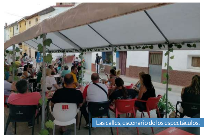
Las calles, escenario de los espectáculos.