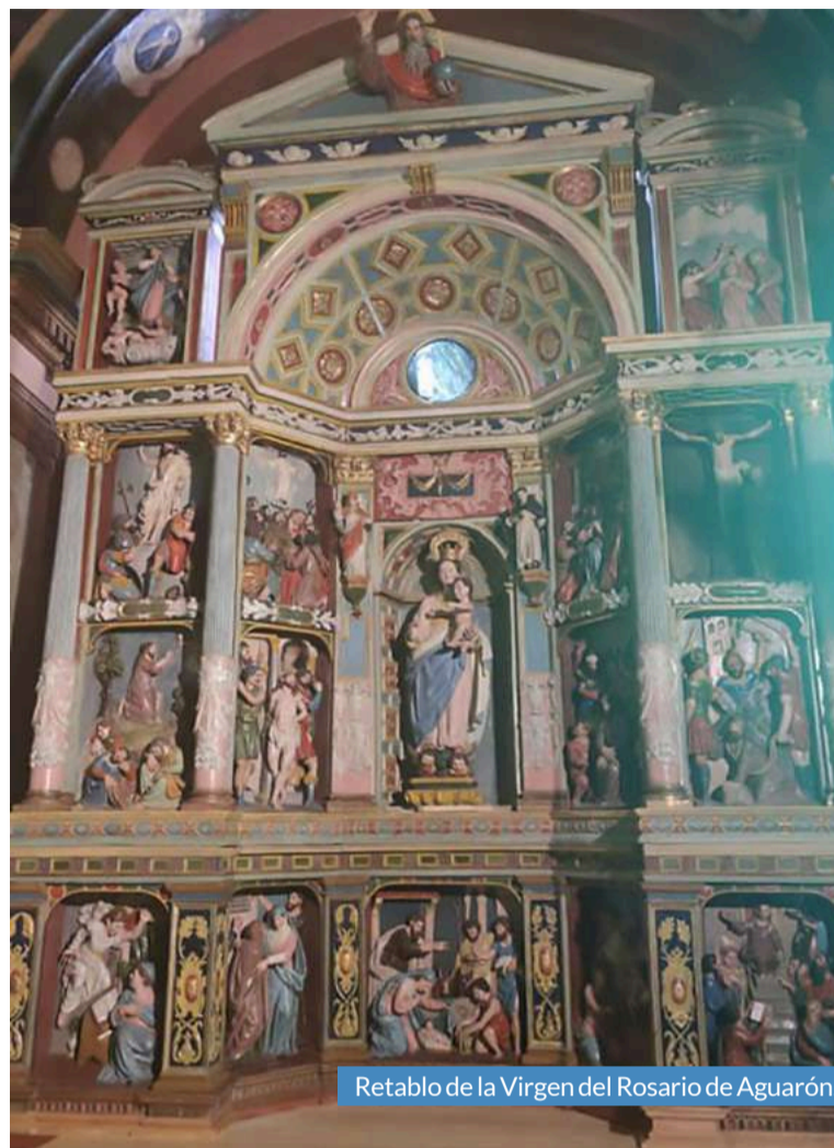
Retablo de la Virgen del Rosario de Aguarón.

esté superada, la imagen de la virgen vuelva a protagonizar el primer fin de semana de septiembre la tradicional procesión pertenece a la Cofradía Virgen del Rosario de la localidad que, además, ha contribuido a la financiación de los trabajos de restauración a través de donativos de los vecinos.