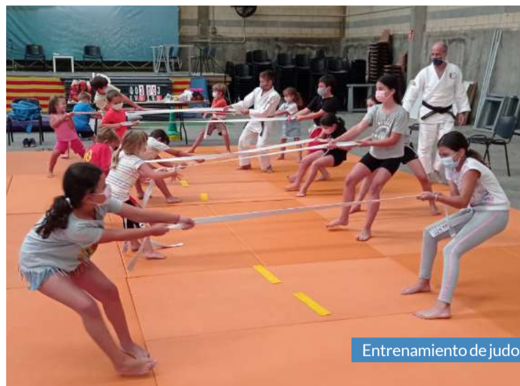
Entrenamiento de judo.