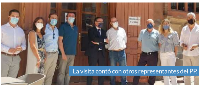
La visita contó con otros representantes del PP.