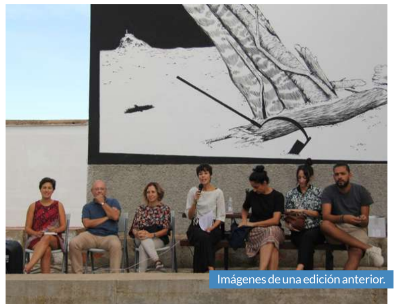
Imágenes de una edición anterior.

Esta edición contará con dos artistas en residencia, y un tercer artista que tra-