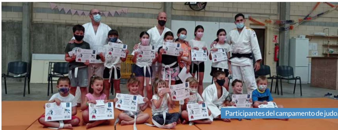
Participantes del campamento de judo.

Mezalocha se convirtió durante este verano en una auténtica escuela de artes marciales. El Ayuntamiento de la localidad puso en marcha junto con el Club de Judo de Zaragoza un campamento que permitió a los más pequeños de la localidad iniciarse en este deporte a través del juego.