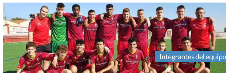
Integrantes del equipo.

Hidalgo desea que “este año sea diferente y que las competiciones puedan celebrarse con la mayor normalidad posible, aunque el año