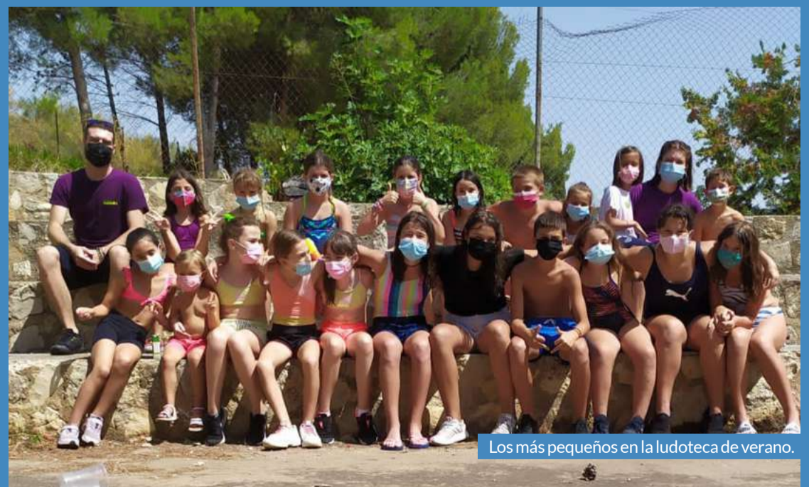
Los más pequeños en la ludoteca de verano.