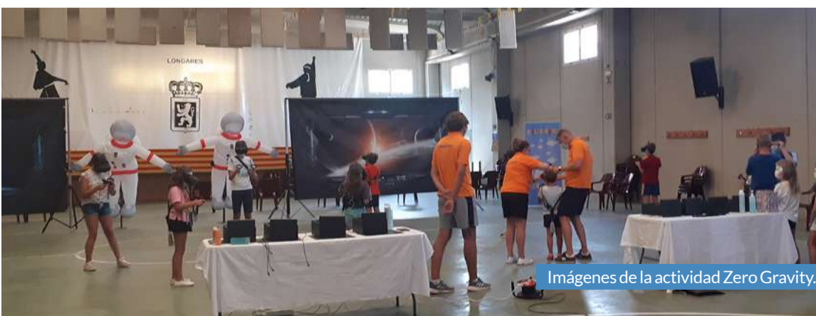
Imágenes de la actividad Zero Gravity.

Aladrén, por su parte, disfrutó del espectáculo de Noemí Espiral y Blancanieves Superheroína en el frontón municipal como escenario.