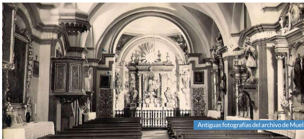
Antiguas fotografías del archivo de Muel.