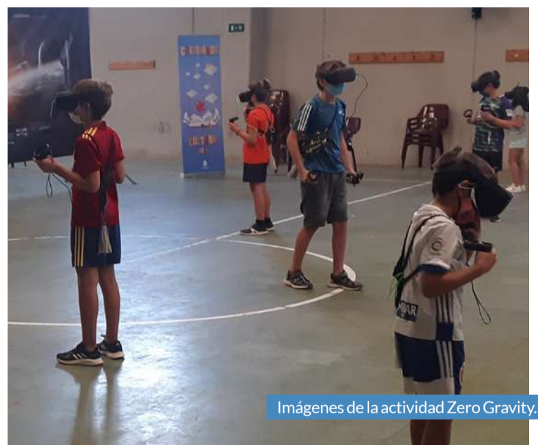
Imágenes de la actividad Zero Gravity.

El cierre de agosto trae consigo la vuelta a la realidad después de unos meses de vacaciones, sol, ocio y descanso. Para hacerlo más llevadero, la Comarca seguirá manteniendo todo el mes de septiembre la programación de Cultivando Cultura, la iniciativa que ha dinamizado de manera muy especial la temporada