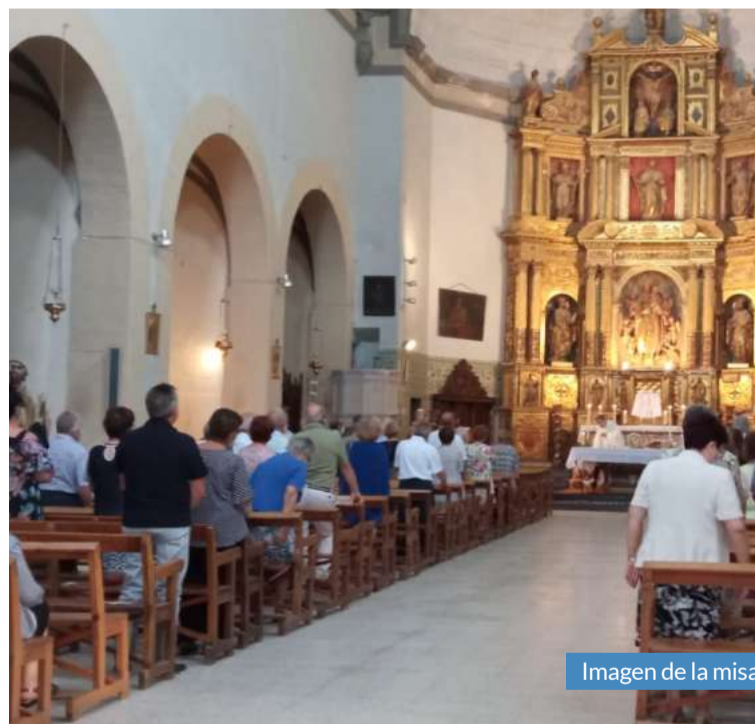
Imagen de la misa.