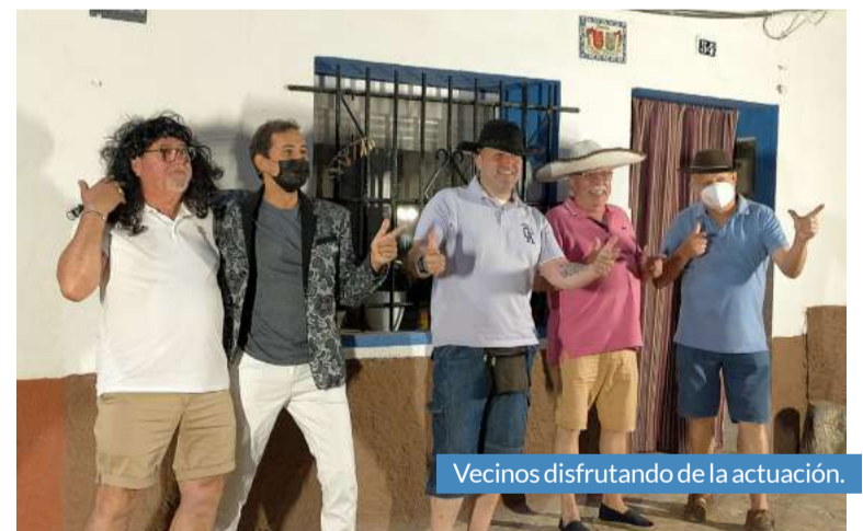
Vecinos disfrutando de la actuación.