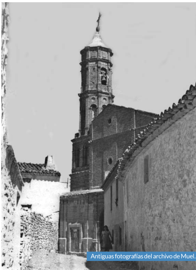
Antiguas fotografías del archivo de Muel.

Desde la asociación se invita a todo aquel interesado a participar en sus labores, bien a través de aportaciones económicas, manos, sugerencias o información de interés.