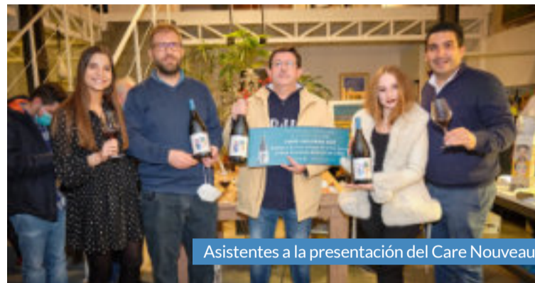
Asistentes a la presentación del Care Nouveau.

El precio de venta al público de Care Nouveau 2021 es de 5 euros.