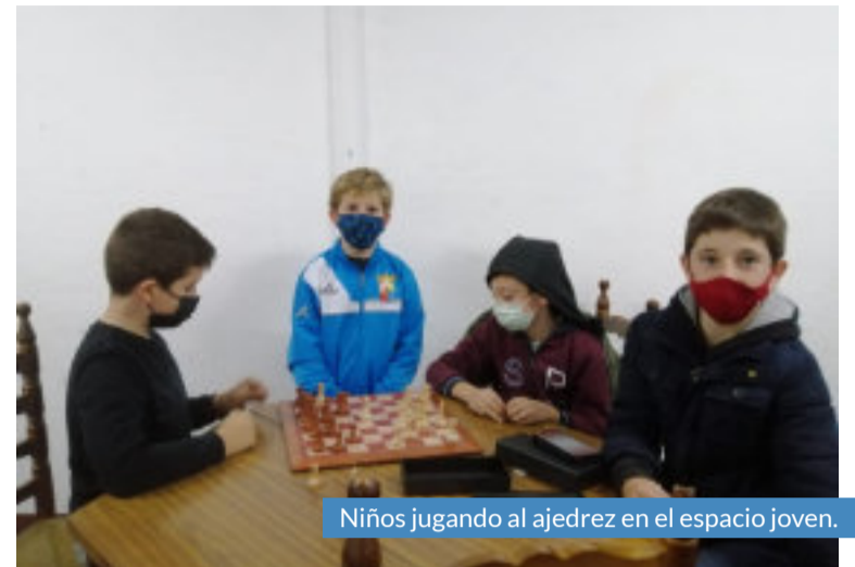
Niños jugando al ajedrez en el espacio joven.

Tal y como atestigua Bernal, “Los dos espacios jóvenes funcionan totalmente diferente y nos ajustamos a las necesidades de cada localidad y de cada núcleo juvenil”. Ambos espacios prestarán sus servicios a los jóvenes ha-