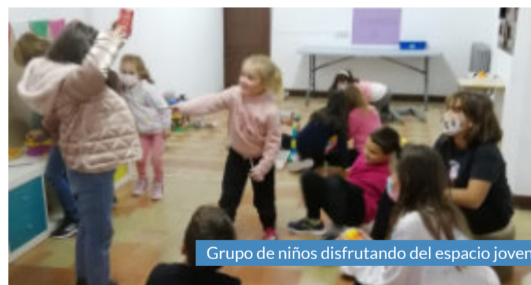
Grupo de niños disfrutando del espacio joven.

sta el mes de mayo, viernes, sábados y, solo en el caso de Cariñena, los domingos (excepto festivos y puentes). El resto de horarios y días de apertura se comunican directamente a los socios conforme a la programación de las actividades.