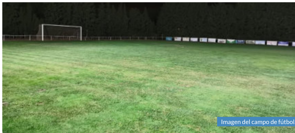
Imagen del campo de fútbol.

ble la segunda pista de pádel ante el éxito de este deporte en la localidad y la necesidad de disponer de más espacios que cubran la demanda.