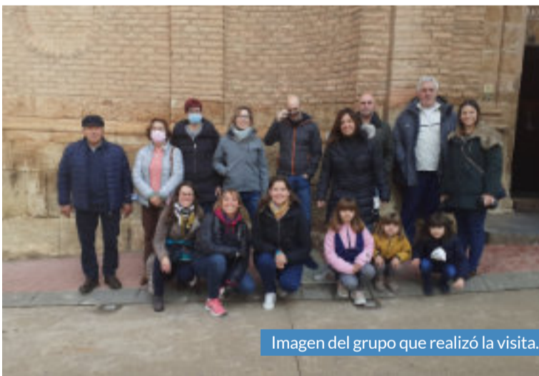
Imagen del grupo que realizó la visita.

Adicionalmente a estas iniciativas, tal y como detalla Hernández, los próximos horizontes de la Asociación ponen las miras en actividades de senderismo y en recuperar los paseos por el monte y el entorno natural. “Nuestro objetivo es conseguir más apoyo porque nuestra agrupación y su éxito ha sido un gran descubrimiento para todos, ahora nos interesa ampliar contactos y acuerdos con entidades de mayor ámbito del consejo regulador, de la D.O., de la Comarca, de la provincia... porque así más gente se podrá unir para participar, asociarse u ofrecer sus conocimientos e inquietudes”, concluye el secretario.