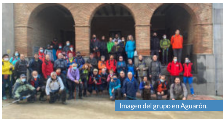
Imagen del grupo en Aguarón.

El Campo de Cariñena pone a disposición del público las rutas organizadas en las distintas paradas del proyecto ‘Una marcha, un mes, un pueblo’. A través de su perfil en Wikiloc, Turismo Comarca Campo de Cariñena, los interesados podrán visualizar cualquiera de los recorridos que suma la iniciativa y descubrir este territorio.