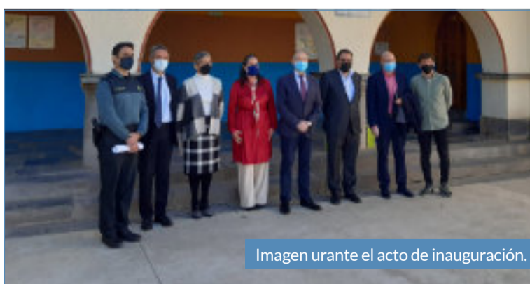
Imagen urante el acto de inauguración.

Uno de los principales objetivos es mejorar el conocimiento de la comunidad escolar sobre prevención de delincuencia, protección de víctimas y cuestiones de seguridad ciudadana, para lo que se desarrollan diversas actividades formativas centradas principalmente en temas como el acoso escolar, delitos de odio, violencia sobre la mujer, drogas y riesgos de internet, dirigidas tanto al alumnado como a las asociaciones de madres y padres, e impartidas por expertos policiales.