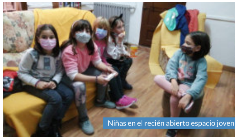
Niñas en el recién abierto espacio joven.