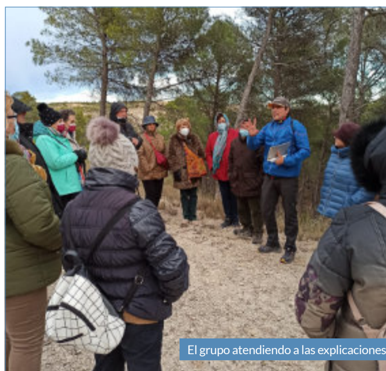
El grupo atendiendo a las explicaciones.

la mejor forma de retomar la actividad e la Asociación de Mujeres Santa Ana de Villanueva.