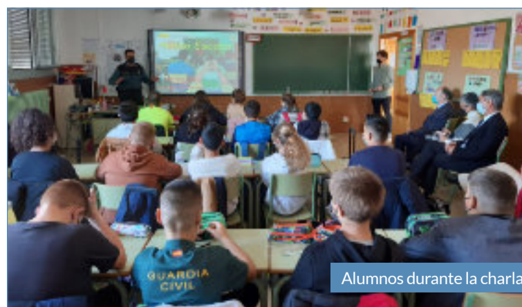
Alumnos durante la charla.