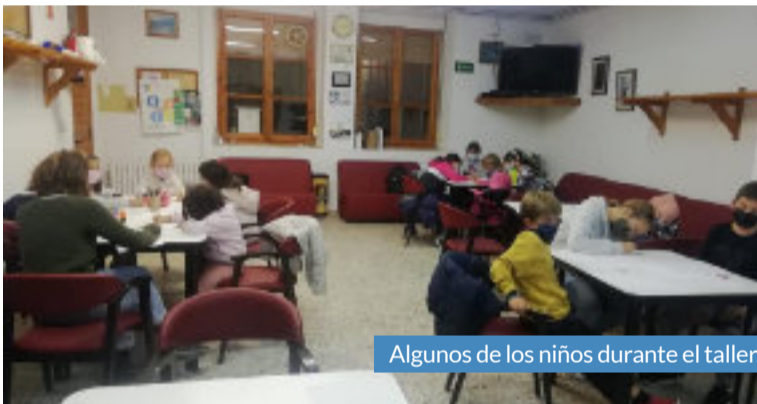
Algunos de los niños durante el taller.

El municipio de Longares disfrutó del original taller de cómic de la mano de XCARMALAVIDA, actividad enmarcada en la campaña de animación a la lectura de DPZ -a través de la Asociación El Paragüero- y que