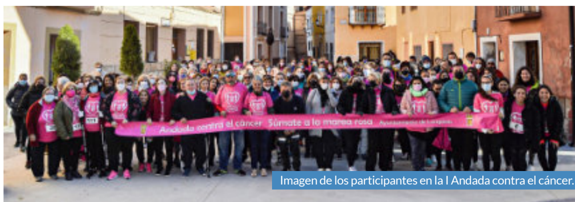
Imagen de los participantes en la I Andada contra el cáncer.

El Ayuntamiento quiere dar las gracias, además de a los participantes, a todos los voluntarios por su colaboración e implicación desinteresada. Sin ellos la andada no hubiera sido posible.