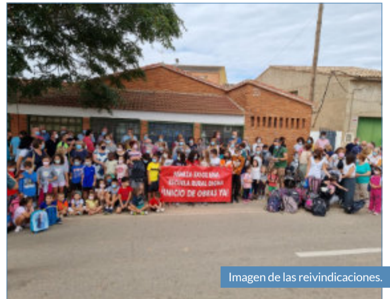
Imagen de las reivindicaciones.