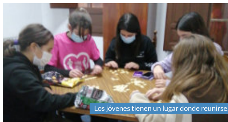
Los jóvenes tienen un lugar donde reunirse.