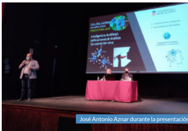
José Antonio Aznar durante la presentación.