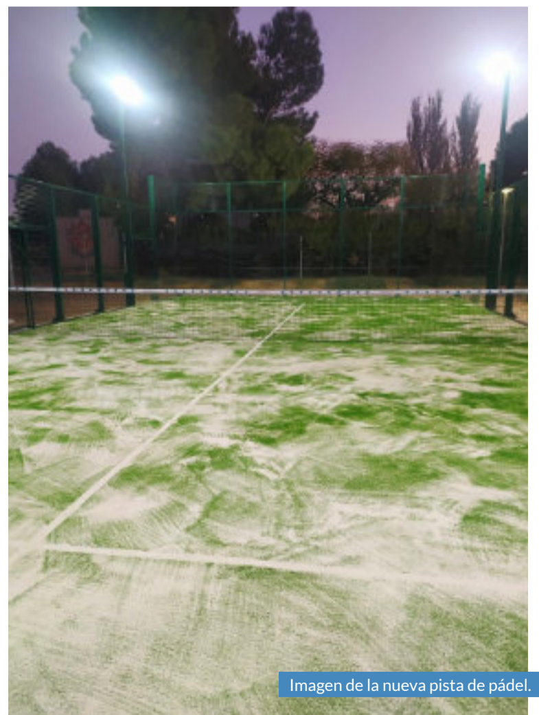
Imagen de la nueva pista de pádel.

El municipio también ve como se inician las obras de demolición del antiguo consultorio médico en la calle Mayor, donde posteriormente se creará una pequeña plazoleta anexa a la iglesia de San Miguel, con el objetivo de potenciar y dar más visibilidad a este monumento declarado Bien Catalogado del Patrimonio Cultural Aragonés.