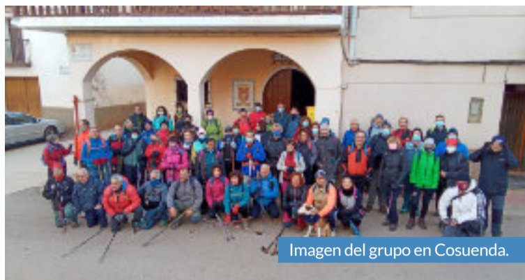
Imagen del grupo en Cosuenda.